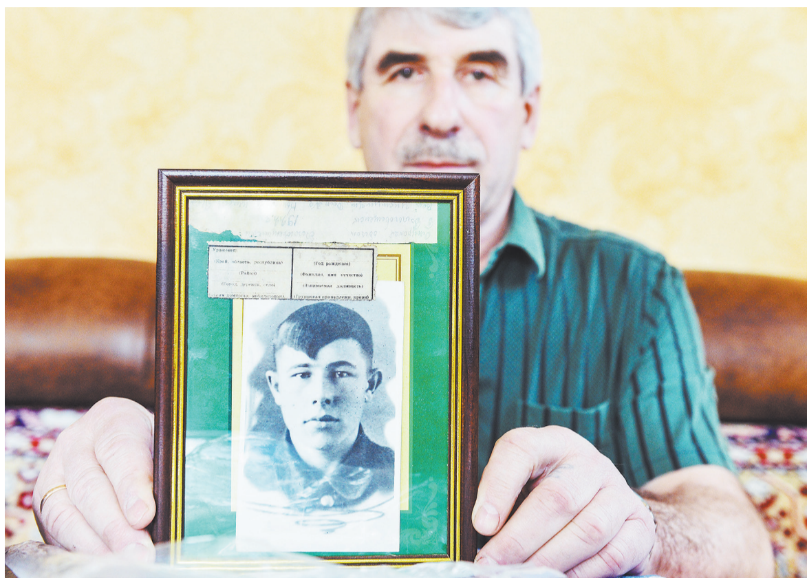
Фотография погибшего красноармейца и клочок бумаги 72-летней давности — самые ценные вещи в семье Кононенко.