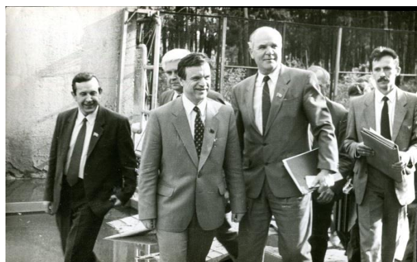
Вместе с руководителями страны