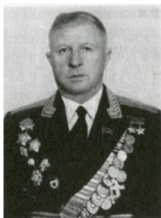
Дважды герой Советского Союза Александр Родимцев