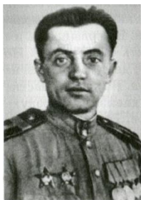
Герой Советского Союза Яков Павлов