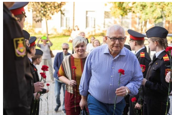
Приезд. Кадеты дарят гвоздики гостям