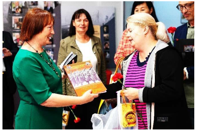
Вручение подарков и книг