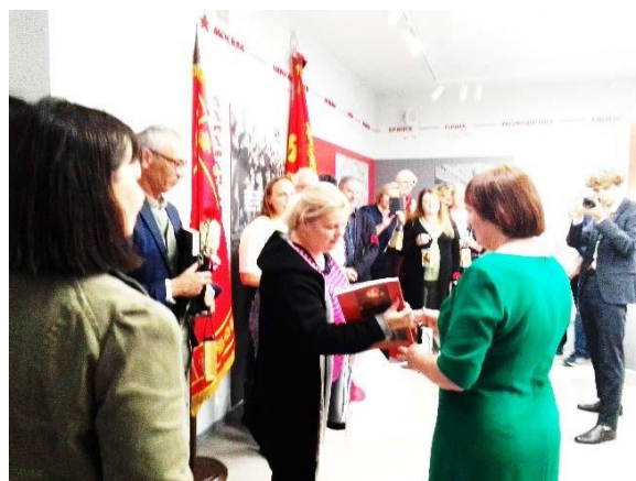
Вручение членам московской делегации памятных книг, писем, подарков