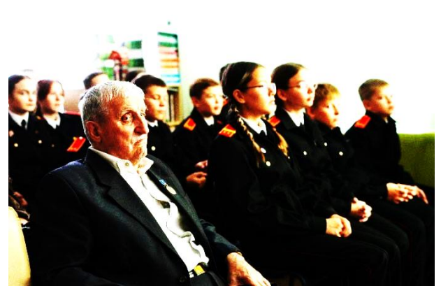
В библиотеке школы