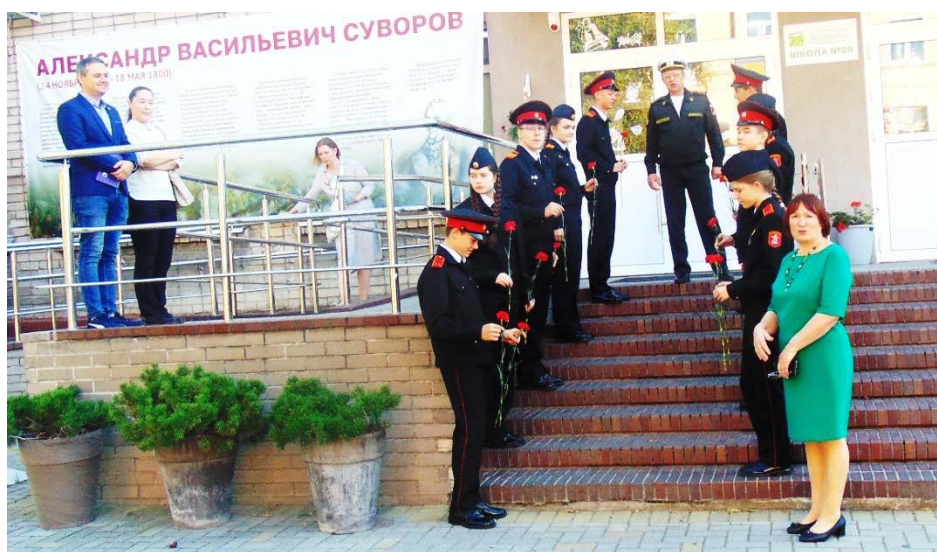
В ожидании гостей