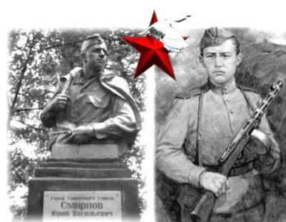
Мама, я не умер. Я воскресну. Чтобы дотянуться до звезды...