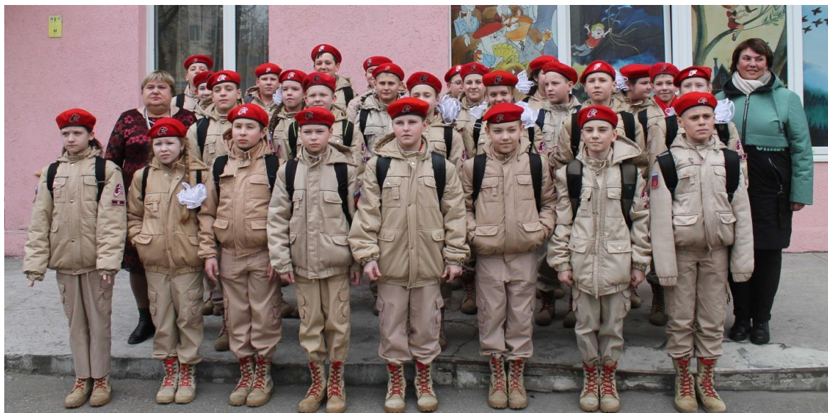
Юнармейцы у входа в библиотеку имени С. Михалкова