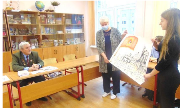
На ней поверженный рейхстаг, красное знамя! Молодец девушка!