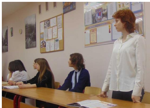
Звенел звонок, надо было заканчивать, но мне нужно было рассказать о предстоящей знаменательной дате – 80-летию Сталинградской битвы.