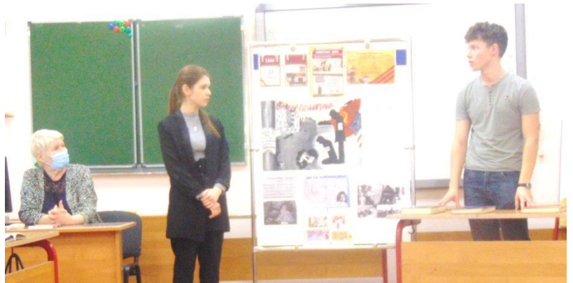
Ребята рассказывали о блокаде, как это было тогда, в то страшное время