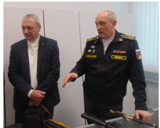
Начальник Центра подробно отвечает на все вопросы ветеранов