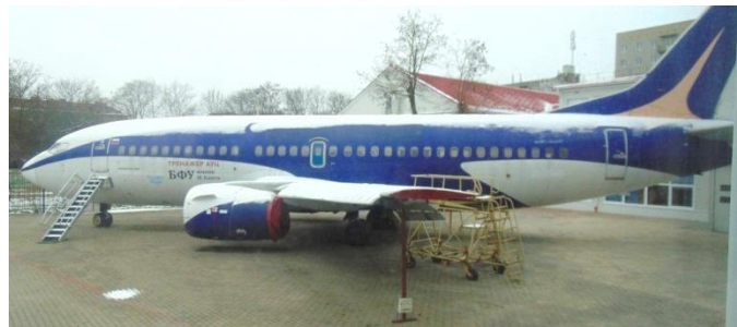
Во дворе вот такой самолёт!