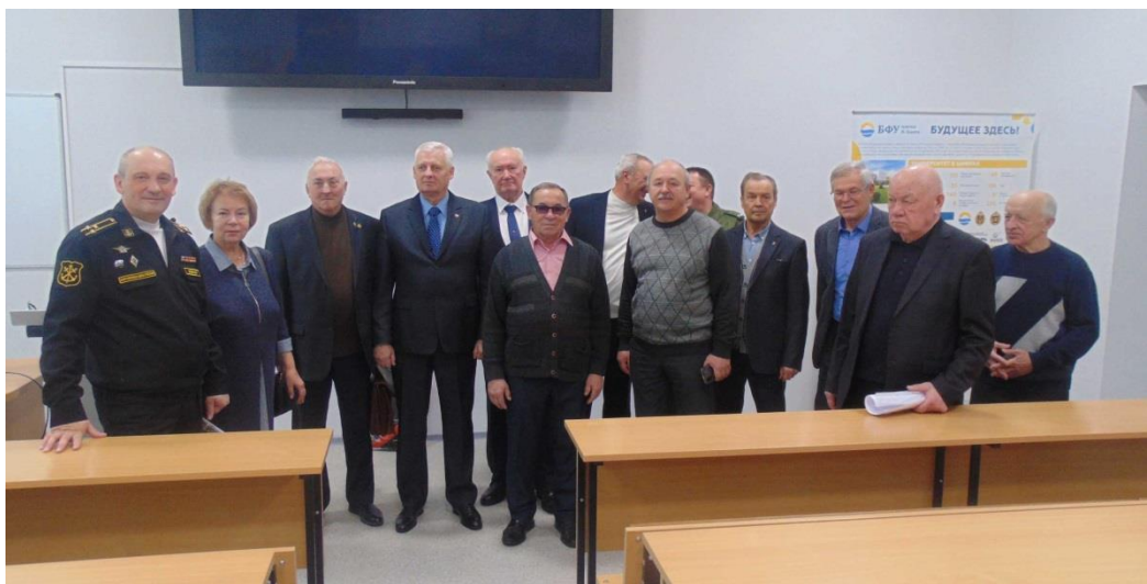
Общий снимок в этом классе