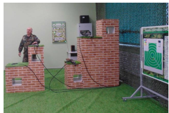
Класс стрелковой подготовки. В нём ветераны потренировались в стрельбе из современного автомата и пистолета