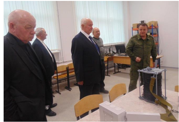
В классе самых современных технических средств связи