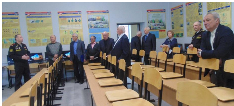
Класс общей подготовке