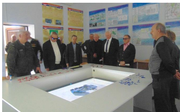
Очень интересный тактический класс