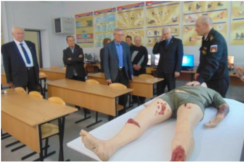
Класс медицинской подготовки