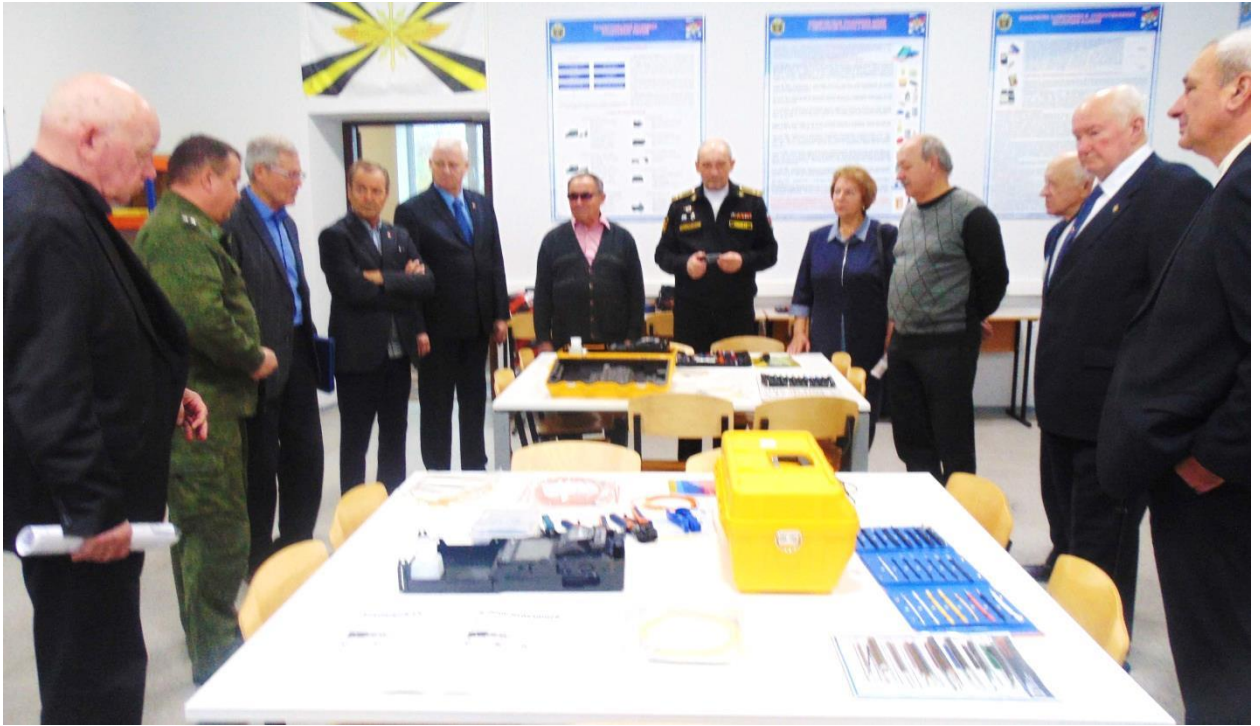
В одном из учебных классов