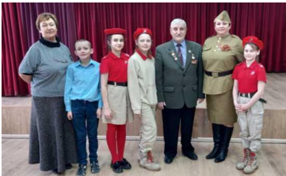
Фото с юнармейцами