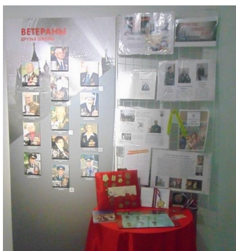
Стенд о ветеранах