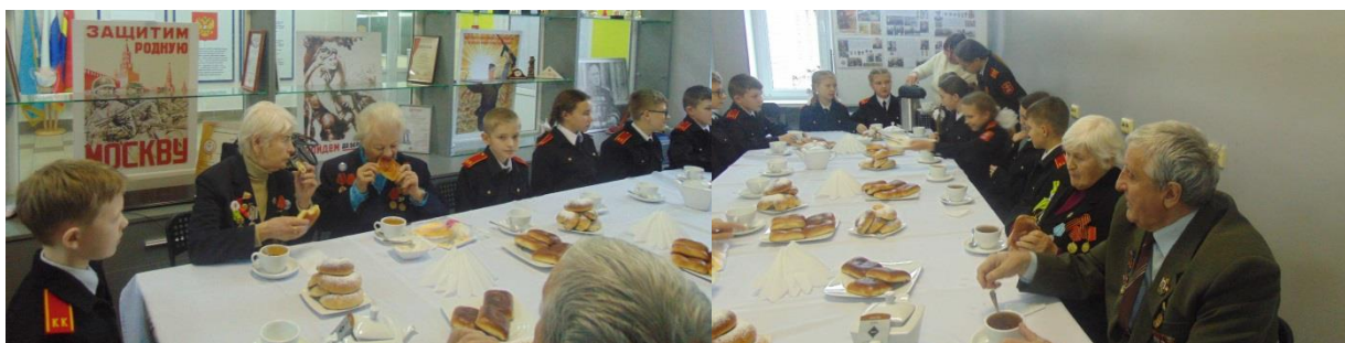
Прекрасный чай, а пирожки – класс!