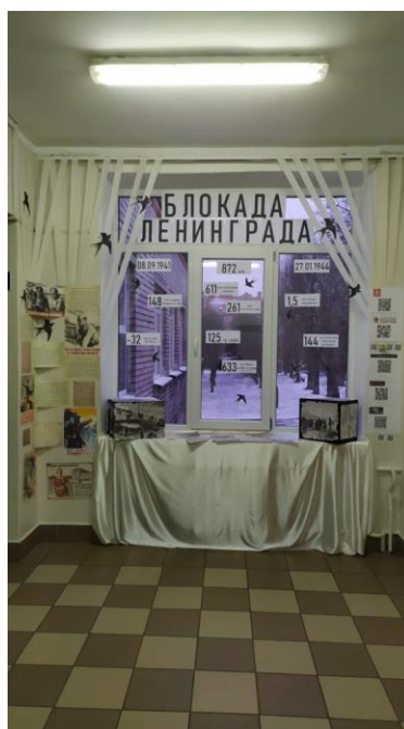
В коридоре школы