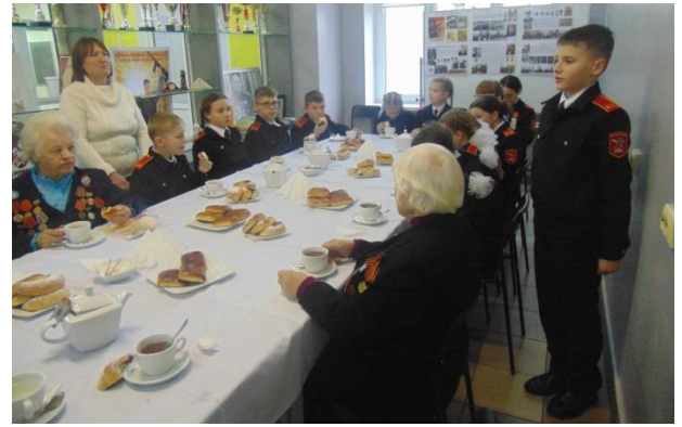
Ветераны рассказывали свои истории, кадеты - стихи