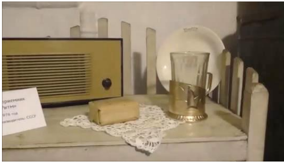
Приёмник, мыло, подстаканник со стаканом