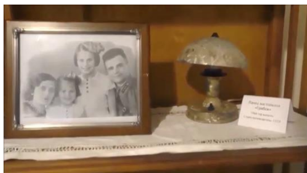
Фото первых переселенцев