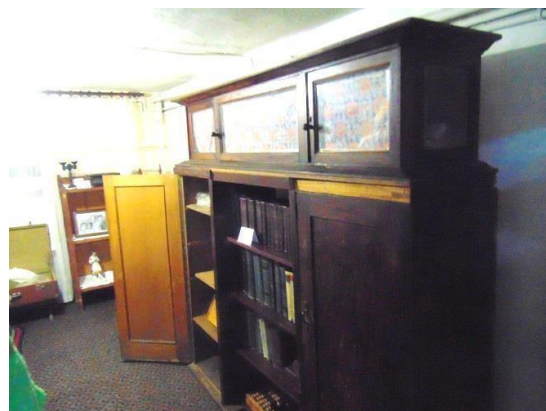
Это немецкий буфет 1920-х годов