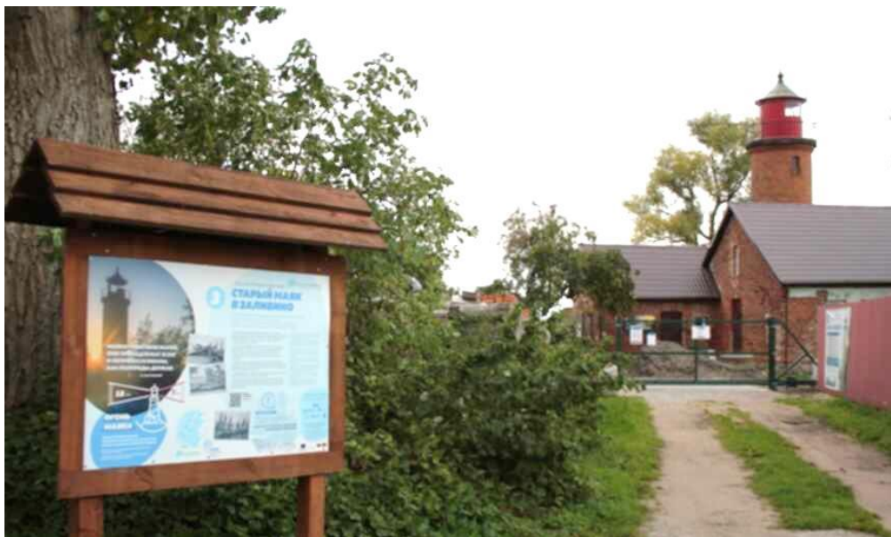
Вид Маяка со стороны посёлка Заливино