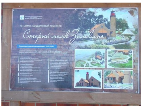
Табло о Маяке

К маяку строители проложили эко тропу ( Тропу здоровья ) – это деревянный настил проходит вдоль Куршского залива, длина которого 55 метров, а ширина 1,4 метра.