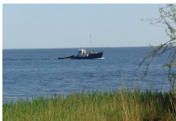
А это – рыболовецкий катер

Сделаю небольшое отступление: Здесь бесконечно романтично. Кирпичное здание дома зрителя и само здание Маяка , где каждый кирпич имеет клеймо. Берег с огромными валунами, выложенными для его защиты от размыва