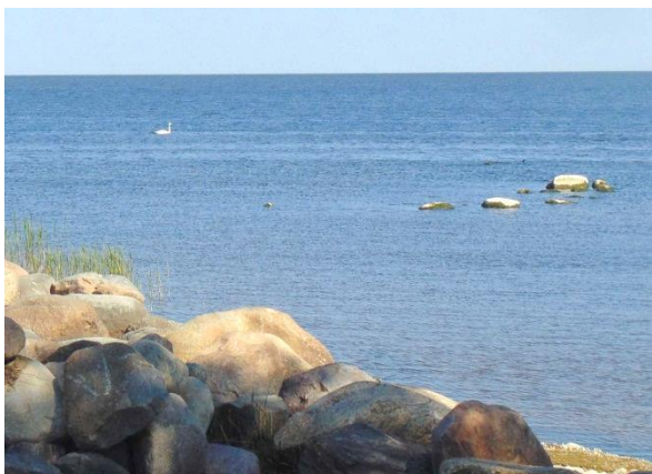
Вдали плывёт белый лебедь