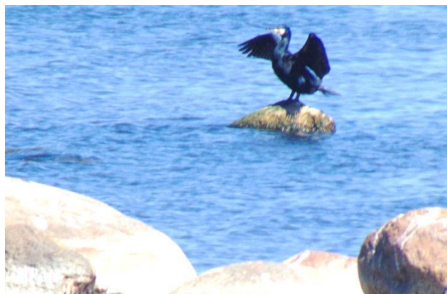
А это баклан, расправив крылья, сушит перья