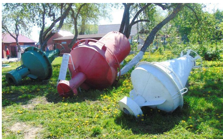
Выставка «Морской буй!»