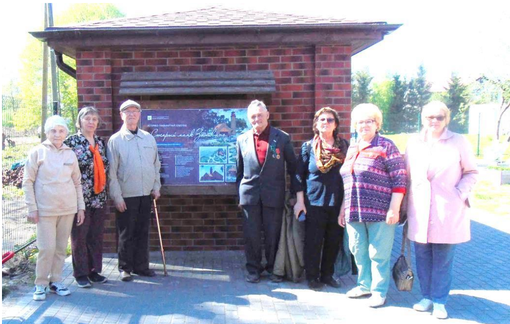
Ветераны Балтийского Совета ветеранов города Калининграда