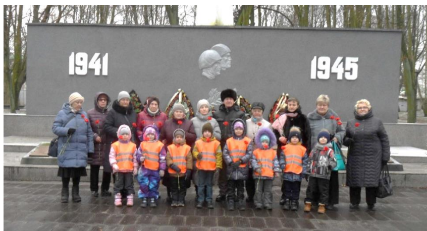
Ветераны с детьми